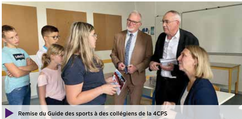
Remise du Guide des sports à des collégiens de la 4CPS

Autre satisfaction : la communication de la communauté de communes est gérée en toute autonomie , en s'appuyant sur un agent entièrement dédié à cette mission. Grâce à cette organisation, qui nous permet d'être plus efficaces et réactifs , nous sommes, depuis ce mandat, présents sur les principaux réseaux sociaux internationaux (Facebook, LinkedIn, Instagram) et locaux ( IntraMuros ). Nous avons également pu créer de nouveaux outils de communication, dont une newsletter et plusieurs livrets thématiques (guide des mobilités, guide du tri sélectif, guide de la petite enfance...) qui ont bénéficié d'une large diffusion auprès de la population de notre territoire. Le guide des sports, qui rencontre un beau succès, a notamment fait l'objet d'une distribution spécifique dans les trois collèges du territoire. Tous ces documents sont prioritairement diffusés sous forme numérique, afin de limiter les impressions dans une logique de sobriété environnementale.