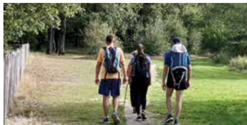
▶ Des chemins pour découvrir chaque commune de la 4CPS

Dans cette continuité, une station de trail vient d'être ouverte au cœur de Sillé-Plage, avec le concours financier du Département, afin d'encourager les sportifs à emprunter ces circuits de découverte.