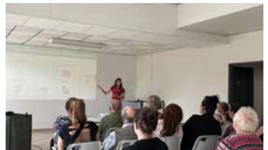
▶ De nombreux habitants ont récemment été formés à l'usage des composteurs individuels

Depuis 2024, chaque collectivité a l'obligation de proposer des solutions de compostage des déchets putrescibles (déchets verts et de cuisine) à tous les ménages. Dans ce but, la communauté de communes a distribué près de 800 composteurs individuels entre avril et juin 2025, à l'issue de formations gratuites dédiées à l'usage de ces équipements. De nouvelles réunions sont prévues pour la rentrée. Vous pouvez dès maintenant vous inscrire sur www.4cps.fr/composteur (inscription obligatoire).