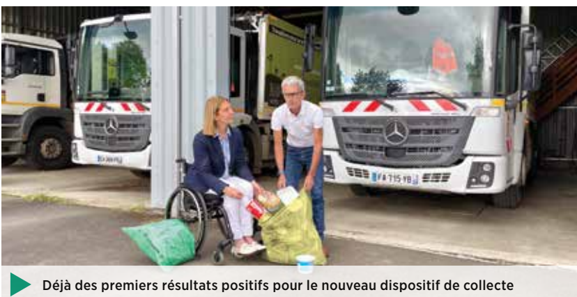
▶ Déjà des premiers résultats positifs pour le nouveau dispositif de collecte

Dès à présent, nous constatons que la majorité des habitants est satisfaite de cette évolution et qu'elle respecte bien les nouvelles consignes. Déjà, les erreurs de tri sont en nette diminution, de même que les dépôts sauvages. Ces résultats devraient, par conséquent, nous permettre de mieux maîtriser le montant de la redevance. Ils sont le fruit de l'important travail que nous avons réalisé en amont du lancement de la collecte, pour rencontrer et dialoguer avec les habitants. Les réunions publiques que nous avons organisées nous ont permis de bien expliquer le nouveau dispositif afin que chacun le comprenne et se l'approprie. Je salue, à cette occasion, l'excellent travail effectué par l'ensemble du personnel communautaire en charge de la gestion des déchets : agents des déchèteries et du service environnement, ripeurs et chauffeurs ainsi que les agents du pôle intercommunal assurant l'accueil. »