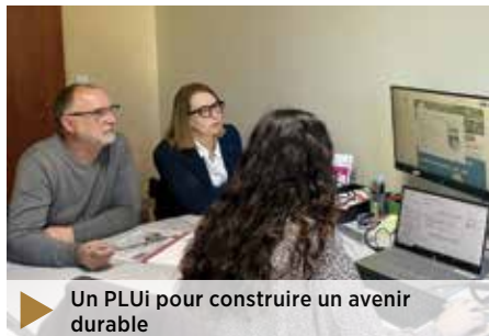
Un PLUi pour construire un avenir durable

« Dès le début du mandat, nous avons été contraints de relancer l'élaboration du Plan Local d'Urbanisme intercommunal (PLUi) afin de nous conformer à l'évolution de la loi, profondément modifiée en 2021. Nous avons dû intégrer de nouvelles contraintes, notamment l'objectif de Zéro Artificialisation Nette, qui réduit drastiquement notre capacité à urbaniser.