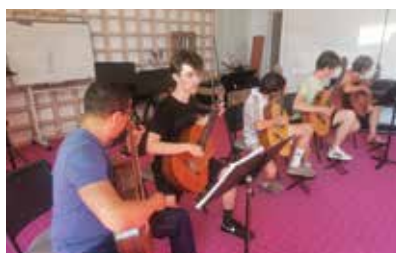
La Maison de la Musique encourage la pratique collective