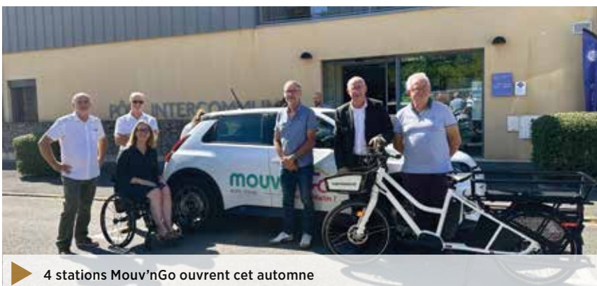
► 4 stations Mouv'nGo ouvrent cet automne

Consultez-la dès maintenant sur www.4cps.fr (mots clés : carte interactive)