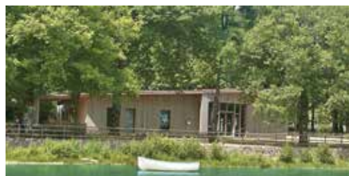
▶ La Maison du Tourisme, la vitrine du territoire et de ses savoir-faire

Ouverte en 2022 au cœur de Sillé-Plage, la Maison du Tourisme a immédiatement été adoptée par les touristes et les habitants. Sa fréquentation a dépassé les 10 000 visiteurs en 2024. Spacieuse et lumineuse, elle constitue un véritable lieu de promotion du territoire. Elle accueille chaque saison plusieurs expositions d'artistes et d'artisans locaux et propose, au sein de sa boutique, de nombreux produits du terroir. Ce remarquable bâtiment n'aurait pas pu être érigé sans le soutien de l'État, qui a financé 80 % de l'investissement.