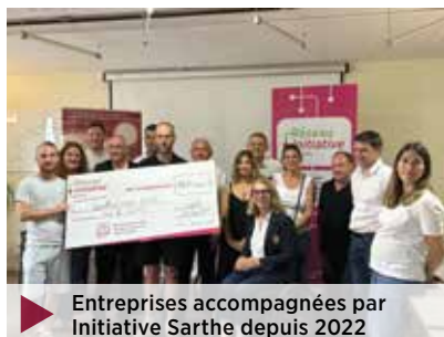
▶ Entreprises accompagnées par Initiative Sarthe depuis 2022

Nous avons aussi valorisé l'économie circulaire, solidaire et sociale en construisant, à Sillé-le-Guillaume, le bâtiment de La Ressource, géré par l'Espace Afajes. Ce service a vocation à accompagner l'insertion professionnelle de personnes éloignées de l'emploi et permet le réemploi d'objets, d'équipements, de vêtements... »