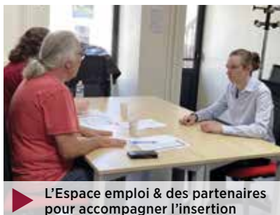
▶ L'Espace emploi & des partenaires pour accompagner l'insertion