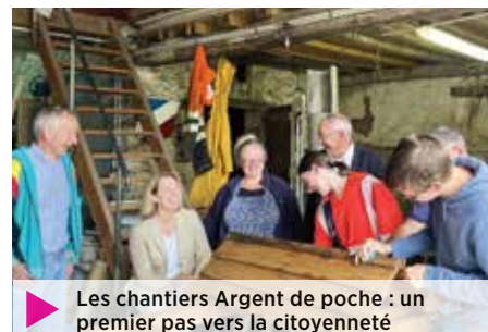
Les chantiers Argent de poche : un premier pas vers la citoyenneté

Nous favorisons aussi les liens intergénérationnels, à l'image des Journées en famille organisées chaque année après la rentrée. Celles-ci mettent en valeur les acteurs locaux, le travail avec nos partenaires - l'Espace Afajes et la MSA - et contribuent à renforcer les liens entre enfants et parents.