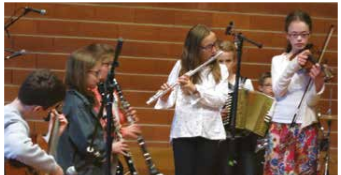
▶ Tous les élèves du territoire peuvent s'éveiller à la musique

l'action menée par la Maison de la Musique et la Communauté de communes. »