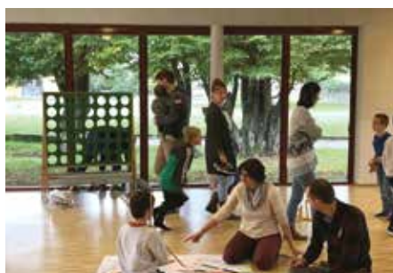
4 écoles ont participé à l'initiative

psychomotricienne), temps de partage (spectacles, lectures, etc.), projection d'un documentaire, matinée en famille, expositions, etc.