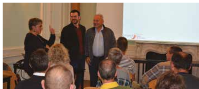
▶ De nombreux participants à cette soirée

Au cours de cette soirée, de précieux conseils ont été apportés pour construire un projet à travers la présentation d'éléments concrets : prise en charge de la formation, des salaires, etc. Chacun a ainsi, pu faire le point sur sa situation professionnelle et engager, éventuellement, une démarche d'évolution professionnelle et, par le biais de la formation, accroître ainsi ses qualifications.