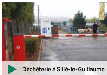
▶ Déchèterie à Sillé-le-Guillaume