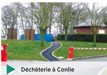
▶ Déchèterie à Conlie

Les habitants de toute la Communauté de communes ont indifféremment accès aux deux déchèteries intercommunales situées à Conlie et à Sillé-le-Guillaume, ainsi qu'à la plateforme de déchets verts à Degré, quel que soit leur commune d'habitation. Pour accéder à ces sites, chaque usager doit se munir du badge qui lui a été fourni par la Communauté de communes.