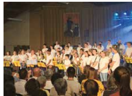
▶ Le projet rassemblera tous les services de la Maison de la Musique

enseignants et de favoriser les échanges entre les adultes et les jeunes. Ce projet pilote, ambitieux et intense, fait franchir de nouvelles frontières artistiques. Il montre, surtout, notre volonté d'encourager l'investissement de tous les acteurs locaux pour garantir l'accès de tous les citoyens à la culture. »