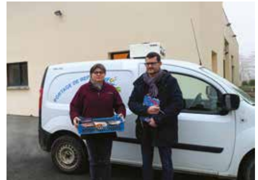
Pour les usagers, le service reste quasi identique

Pour la cinquantaine d'utilisateurs du service sur le territoire, ce changement de gestionnaire entraînera quelques évolutions de la prestation à partir de début janvier (tarifs, jours et heures de passage ...). La Fédération ne proposera plus d'accueil à Conlie.