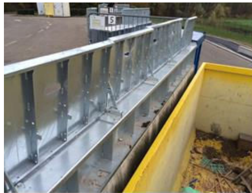
Exemple de système antichute

Concernant la benne « Gravats », le cahier des charges préconisera un système :